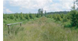
A l'ouest de la N. 89. Bois Sainte- Gertrude. +/- 540 m. Plateau fagnard identifié par une végétation de joncs à l'avant-plan.