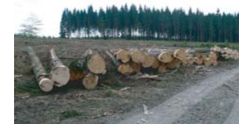
Lieu-dit La Surveillance (nord-ouest de la barrière de Champlon), paysage de sylviculture. Contraste entre l'effet d'ouverture des zones de coupe et les boisements denses et sombres fermant le paysage