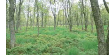
Paysage "relique" de la réserve du rouge Ponce