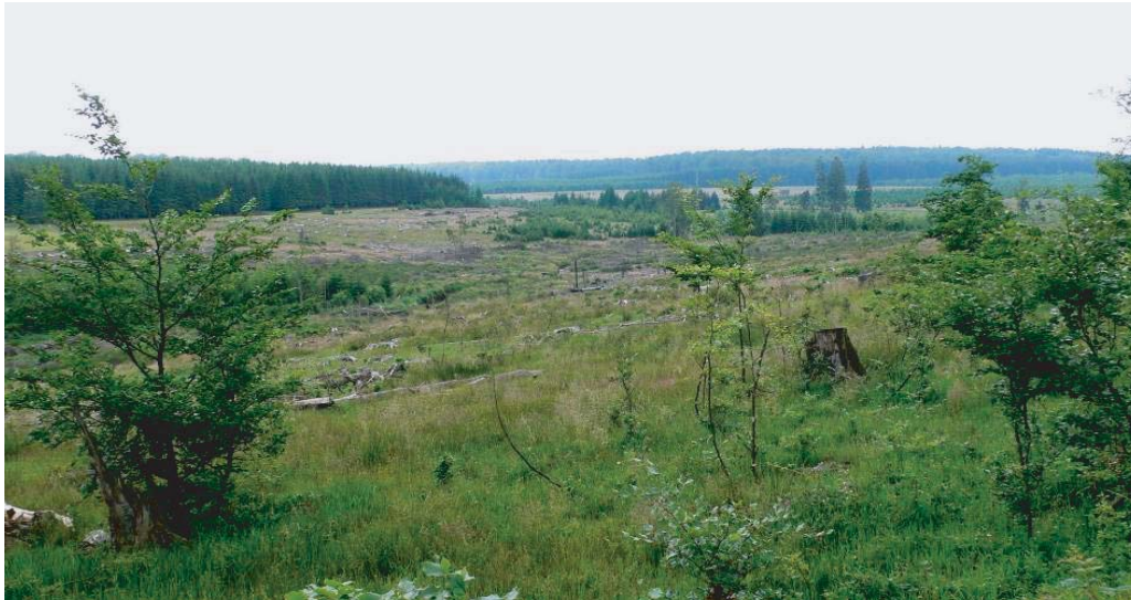
Fagnes de Mochamps, vallée de la Wamme. Vue vers l'ouest en direction du hameau de Mochamps.